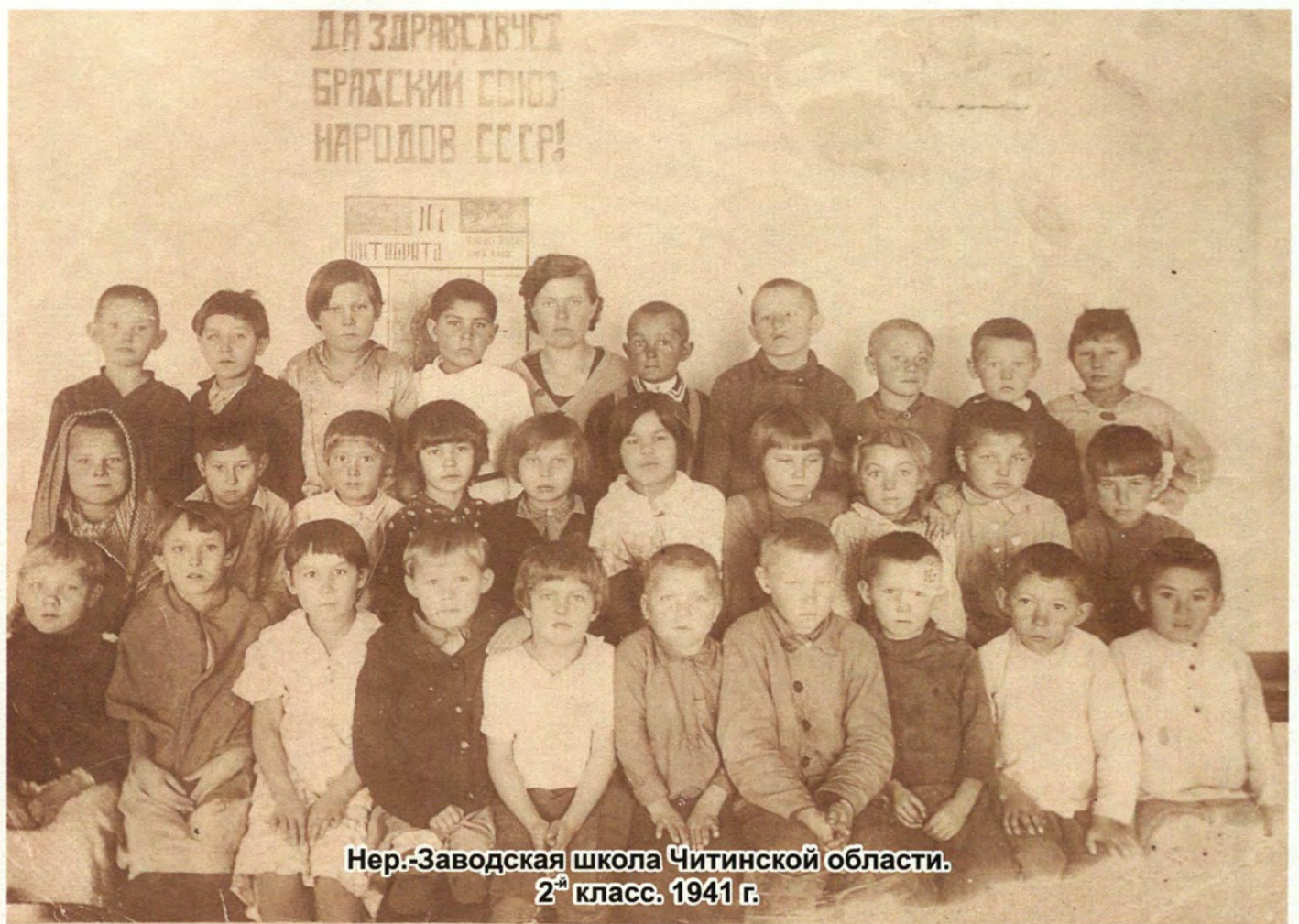
Нер.-Заводская школа Читинской области. 2 ой класс. 1941 г.