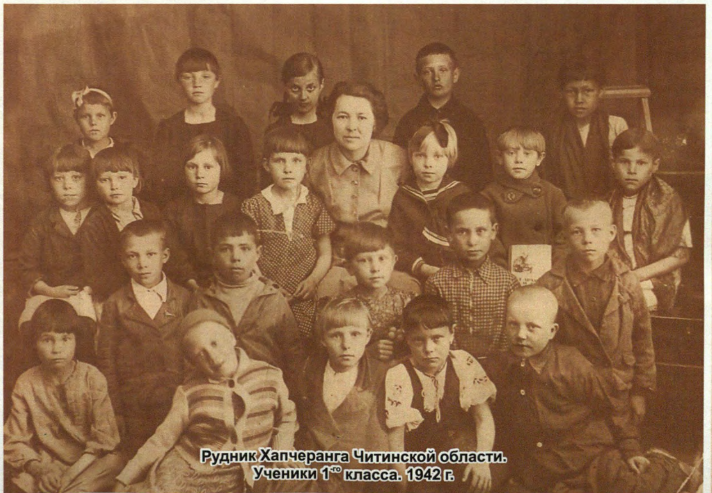
Рудник Хапчеранга Читинской области. Ученики 1 ого класса. 1942 г.