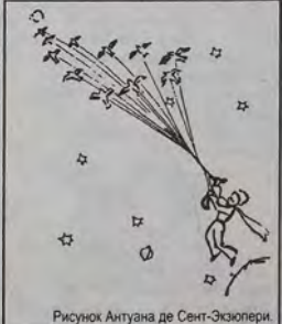
Рисунок Антуана де Сент-Экзюпери.

Я их приветствую стихами. Их нежность и любовь спасет. И пусть Чита хоть петухами кричит — яичко не снесет!