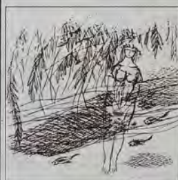
Рисунок Юрия Круглова